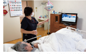
■医療的ケア(服薬・経管栄養等) 看護師が、ご利用者様の状態に応じた適切なタイミングで実施。