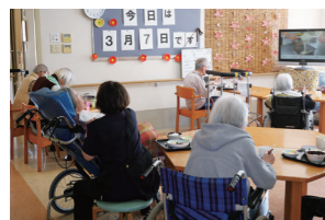
■お食事 それぞれのペースで。