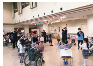
■レクリエーション・行事 クッキングや季節行事等で日常に彩りを。保育園児との交流で幼老共生も実現。