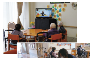
■ティータイム おやつを楽しみながら、ゆったり過ごす。