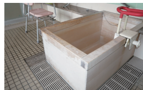
■ご入浴 特浴やヒバ(ヒノキ)製風呂で、安心して入れる設備。