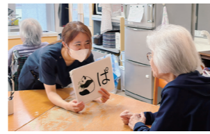
■体操 "ばたから体操"や"ユニット体操"等、て体を動かす。