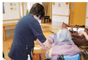
■ショートステイ ご利用者様をお迎え・バイタル測定・持ち物チェック等を行う。