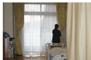
■起床 朝の光で一日が始まる。