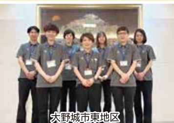
大野城市東地区 地域包括支援センター