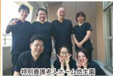
特別養護老人ホーム悠生園 4F