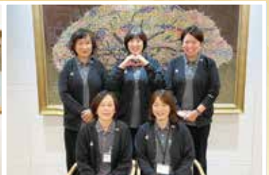
悠生園ケアプランセンター