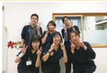
中央デイサービスセンター