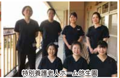
特別養護老人ホーム悠生園 3F