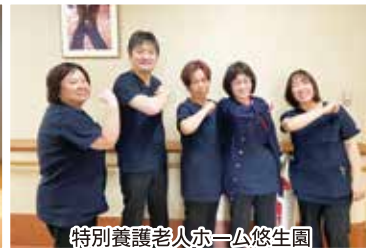
特別養護老人ホーム悠生園 看護部