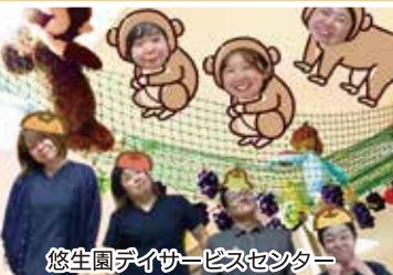
悠生園デイサービスセンター サテライトだんらん