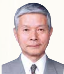
社会福祉法人 悠生会 理事長