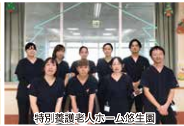
特別養護老人ホーム悠生園 2F