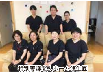
特別養護老人ホーム悠生園 ユニット