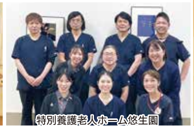
特別養護老人ホーム悠生園 機能支援部