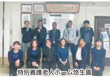
特別養護老人ホーム悠生園 法人部・地域連携部