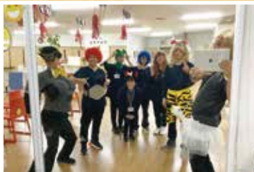
悠生園デイサービスセンター