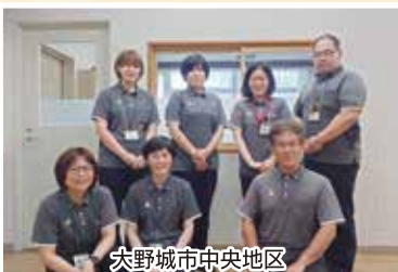
大野城市中央地区 地域包括支援センター