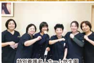
特別養護老人ホーム悠生園 看護部