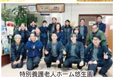
特別養護老人ホーム悠生園 法人部・地域連携部