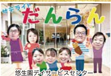
悠生園デイサービスセンター サテライトだんらん