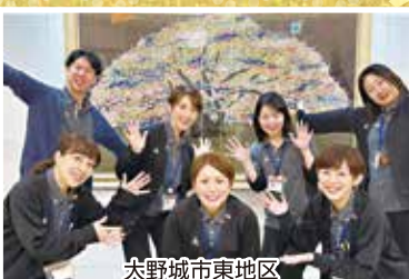
大野城市東地区 地域包括支援センター