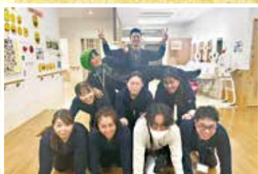
悠生園デイサービスセンター