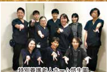
特別養護老人ホーム悠生園 機能支援部