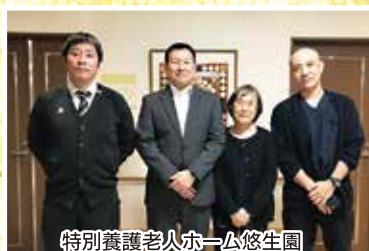
特別養護老人ホーム悠生園 園長室