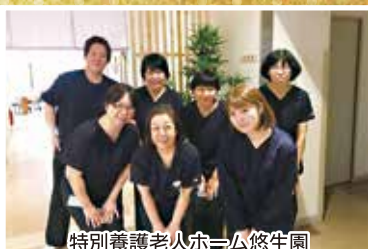
特別養護老人ホーム悠生園 ユニット