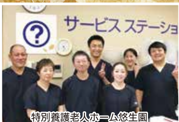
特別養護老人ホーム悠生園 2F