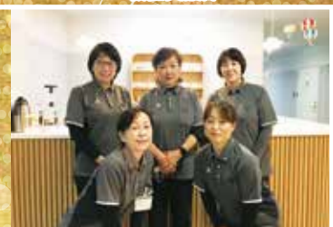
悠生園ケアプランセンター