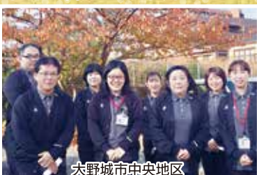
大野城市中央地区 地域包括支援センター