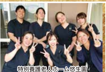
特別養護老人ホーム悠生園 3F