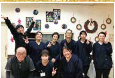
中央デイサービスセンター