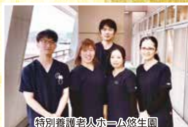
特別養護老人ホーム悠生園 4F